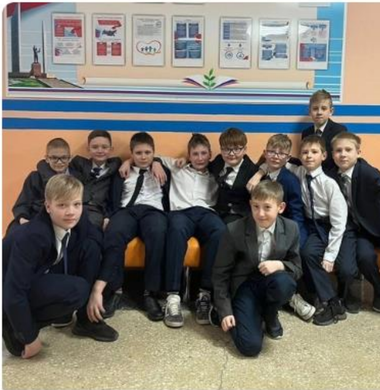
ПРАВИЛА БЕЗОПАСНОСТИ ШКОЛЬНИКА

Дорогие ребята, пусть ваши каникулы будут интересными, увлекательными, веселыми и безопасными! #Лицей5ИмениГерояРоссийскойФедерацииАЖЗеленко